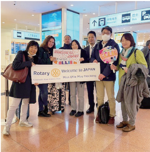
エリーさんお迎え 1 / 22